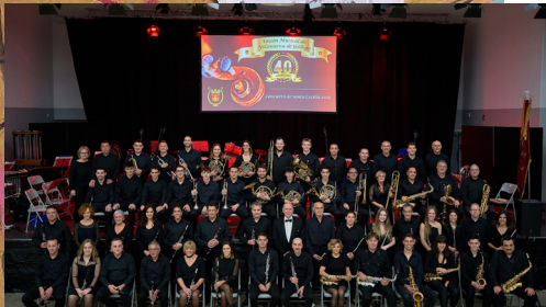
Union Musical Villanueva de Gállego